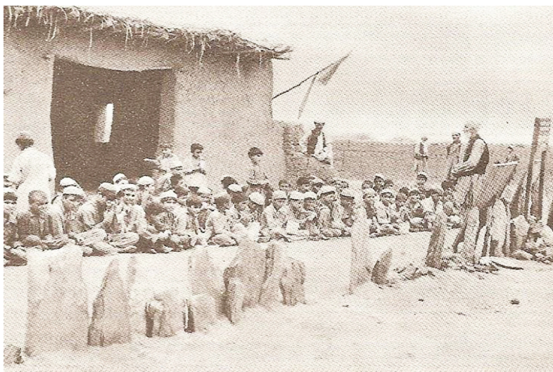
نمونه‌یی از تدریس در کمپ‌های مهاجرین سال ۱۹۸۲

قطع کمک‌ها و ناپدید شدن منابع تمویل موسسات در پشاور، برای مهاجرینی که نتوانستند به داخل افغانستان بروند و یا مهاجرینی که بعلاوه به سوی پاکستان و به خصوص پشاور روی آوردند، به وضاحت محسوس است. مهاجر در وضعیت کنونی، با دشواری می‌تواند کاری بیابد. اگر کاری یافته با نرخ ارزان باید آن را بپذیرد. این مهاجر با دستمزد ناچیز توان آن را ندارد که کودک بیمار خود را نزد داکتر ببرد. چه رسد به آن که توان خریداری نسخه داکتر را پیدا کند. داکتران پاکستانی، از ۵۰۰ تا ۱۰۰۰ کلدار پول معاینه دریافت میکنند. داکتران افغانی که به گونه رسمی وثبت شده معاینه خانه دارند، ۳۰۰ و ۴۰۰ صد کلدار میگیرند. در حالی که داکتران ثبت نشده که بیشتر در منطقه مشهور به "بور" در پشاور معاینه خانه دارند، ۲۰۰ کلدار پول معاینه دریافت میدارند.